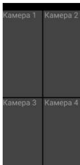
Рисунок 2 - Главное окно ПЭВМ «Видеосалон» на ОС Android