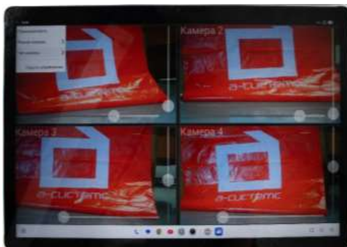
Рисунок 1 - Главное окно ПЭВМ «Видеосалон» на ОС Astra Linux.

2) запуск ПЭВМ «Видеосалон» осуществляется из папки VK/bin/start.sh. После запуска, откроется главное окно программы (Рисунок 1).